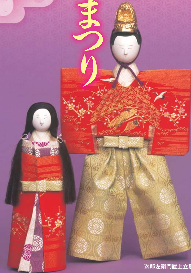
次郎左衛門置上立雛