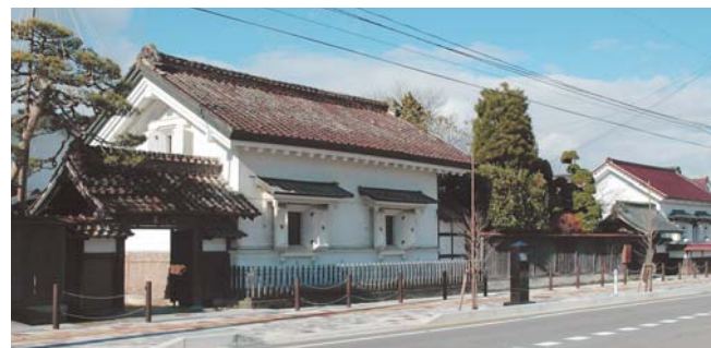
「日本の道百選」ひな市通り