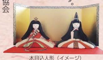
木目込人形 (イメージ)

かわいい人形の制作体験ができます。 ● 4月2日(土)・3日(日) 午前9時30分～午後3時30分 ● 河北町コミュニティセンター3Fホール ※体験は事前申込が必要です。 お問い合わせは (社)河北町観光協会 0297-72-0787まで