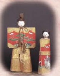
次郎左衛門 置上げ立雛

谷地には多彩な雛がある。初代雛屋次郎左衛門作の置上げ立雛を始め、寛永雛、元禄雛、数々の享保雛、古今雛、次郎左衛門座雛、有職雛、稚児雛、親王雛、芥子雛、さまざまな飾り人形、からくり人形、竹田人形、御所人形、雛道具など数え切れない。